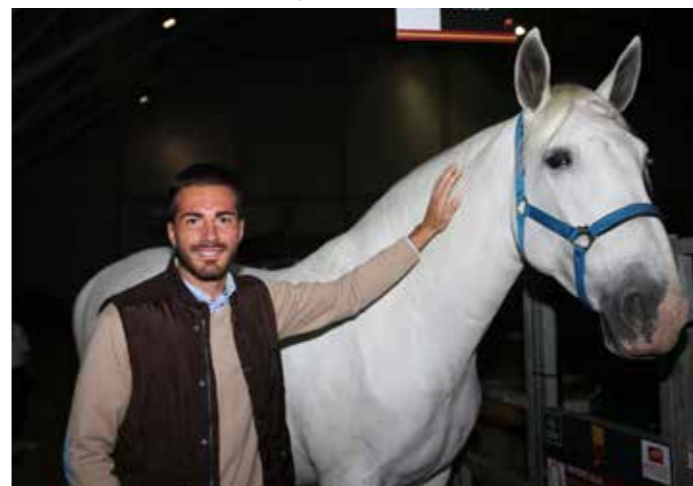
☛ VIP host na SICABu 2015, profesionální fotbalista, brankář Antonio Adán od r. 2014 hraje za tým Real Betis, v předchozích letech 2011-14 byl brankářem Realu Madrid.