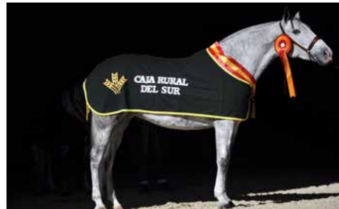
☛ Vítězka kategorie 5 a 6letých klisen a zároveň SICAB šampionka, ENTREGA MATER (o: Judío VII, m: Frondosa J.F. po Elegido XXIII), chovatel a majitel Yeguada Mater Christi.