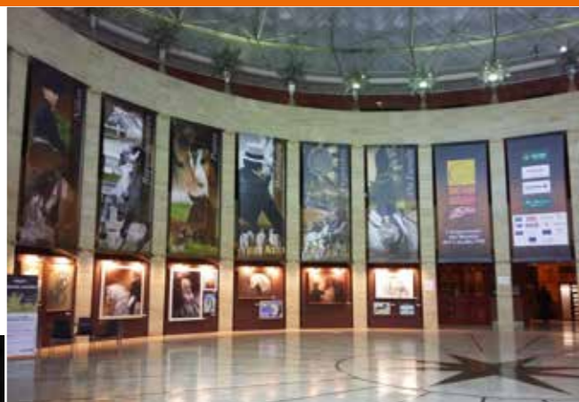
☛ SICAB 2015 vstupní hala s obrazovou přehlídkou P.R.E. koní a jejich využití.