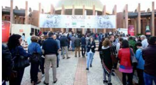
☛ Zástupy čekajících návštěvníků k pokladnám výstaviště před vstupní halou SICABu 2015 v Seville.