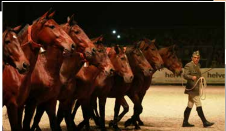
☛ „Cobra“ P.R.E. klisen Yeguada Militar na večerní show Espectáculo.