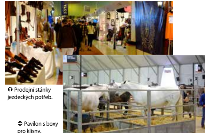
☛ Prodejní stánky jezdeckých potřeb.