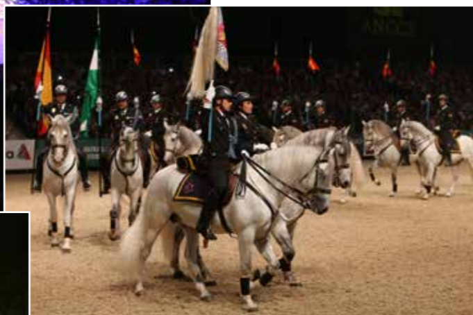
☛ Slavnostní přehlídka španělské jízdní policie na večerní show Espectáculo.