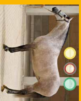
➤ Polosestra hřebce Dobres P.L.C. Haendada Arenas, KVH 166 cm, m. Estuardiana XXXV.

ligentním vyzrazem. Okamžitě jsem se zamilovala. Ani ve snu mě nenapadlo, že by mohl být můj. Další 2 roky jsem potkávala jeho potomky a pravidelně s ním trávil dost času. Nikdy jsem neviděla hřebce, který by dával konzistentně tak kvalitní a sobě podobná hříbčata s tak různými typy klisen. Dokonce i s klisnami menšího vzrůstu dokáže dát potomka se sličnou výškou. Došlo mi, že on je opravdu skvělý plemník. A jeho charakter mě uchvátil. Zbytek byl už obrovské štěstí.