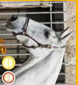
➤ Matka hřebce Dobres P.L.C. Lotus, KVH 172 cm, o-Viboro IV, m. Etna, a současně čtyř letý s tuliem Reproductor Californado. Zde ve věku 24 let.