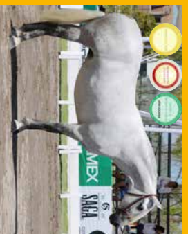
➤ Polosestra hřebce Dobres P.L.C. Callad P.L.C. (nar. 2008, KVH 167 cm), po otci D'Adèle.

Uprimmě, nikdy jsem si nemyslela, že bych vedle Ducada měla ještě dalšího hřebce. Před 2 lety jsem byla opět v Madridu a shodou komplikovaných okolností jsem potkala Dobrese. Na jeho mladý věk byl již tehdy obrovský, lidmi skoro netknutý, po jeho první přípravě sezóně, kdy žil se stádem kobyvek. Udělal na me neskutečný dojem, byl „majestátný“. A při tom tak jemný s inte-